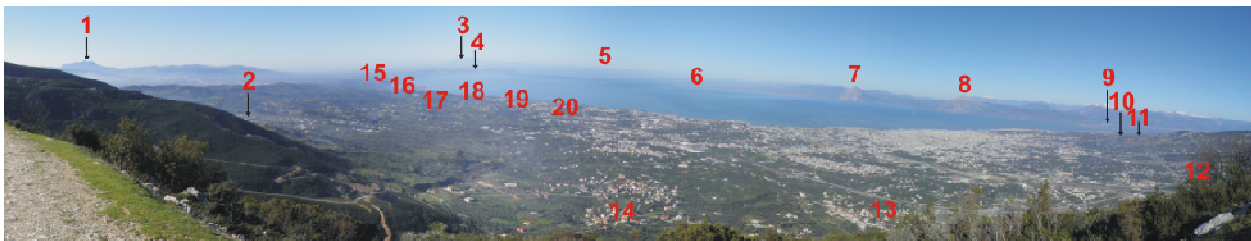
1.Όρος Σκόλλις 2.Καλλιθέοκαμπος (Καλλιθέα) 3.Κεφαλονιά (Αίνος) 4.Τείχος Δυμαίων (Άραξος) 5.Λευκάδα 6.Μεσολόγγι 7.Βαράσοβα 8.Κλόκοβα (Παλιοβούνα) 9.Ρίο-Αντίρριο 10.Αγ. Κυριακή 11.Βούντενη 12.Κλάους 13.Κρήνη 14.Σαραβάλι 15.Νιφορέικα 16.Αλίσσός 17.Καμίνια 18. Τσουκαλείκα 19.Βραχνείκα 20.Μονοδένδρι

Αυτά που αναφέρθηκαν παραπάνω είναι μερικές από τις ιδιομορφίες και τα βασικά χαρακτηριστικά της θάλασσας του Πατραϊκού. Με την παρατήρηση και την εμπειρία λοιπόν, σε μία καλοτάξιδη θάλασσα οι κάτοικοι της δυτικής Αχαΐας της Ύστερης Εποχής του Χαλκού κατέκτησαν τις γνώσεις της ναυτιλίας και έτσι κατάφεραν να αναπτύξουν το εμπόριο και να μεταφέρουν τα προϊόντα και την τοπική παραγωγή τους στα υπόλοιπα κέντρα της Μεσογείου.