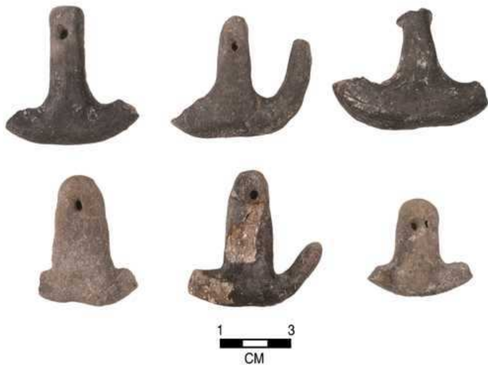
Εικόνα 14: Πήλινες άγκυρες της πρώιμης εποχής του χαλκού από τα Σέρβια

Kenneth A. Wardle, Institute of Archaeology and Antiquity, University of Birmingham < http://artsweb.bham.ac.uk/aha/kaw/Servia/serviaclay.htm >.