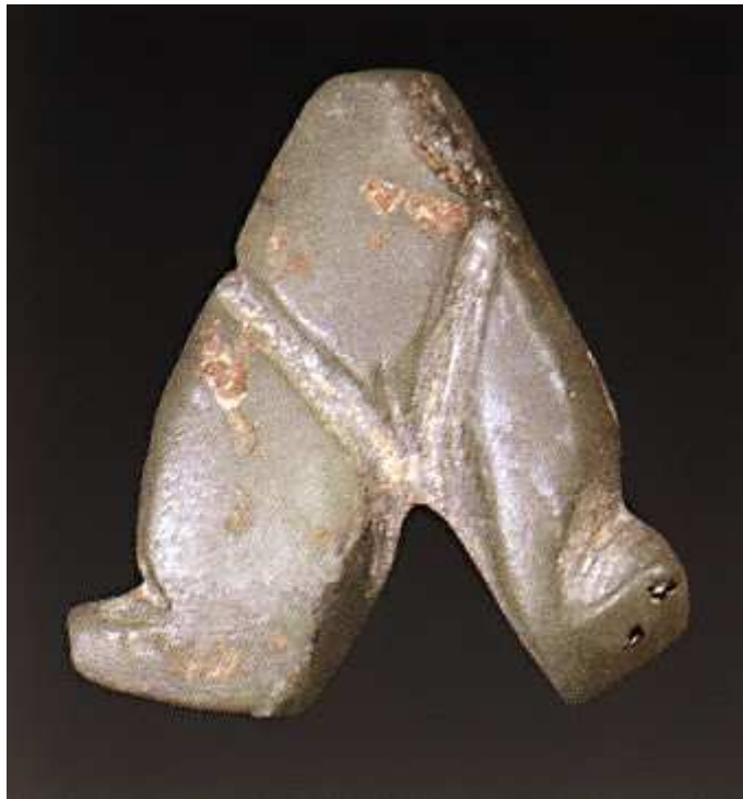
Εικόνα 5: Γυναικείο σχηματοποιημένο ειδώλιο από πέτρα της τελικής νεολιθικής (Σιταγροί, Αρχαιολογικό Μουσείο Δράμας).

Γεώργιος Α. Παπαθανασόπουλος (επιμ.), Ο νεολιθικός πολιτισμός στην Ελλάδα , Αθήνα: Ίδρυμα Νικολάου Π. Γουλανδρή - Μουσείο Κυκλαδικής Τέχνης, 1996, αρ. καταλόγου 200.