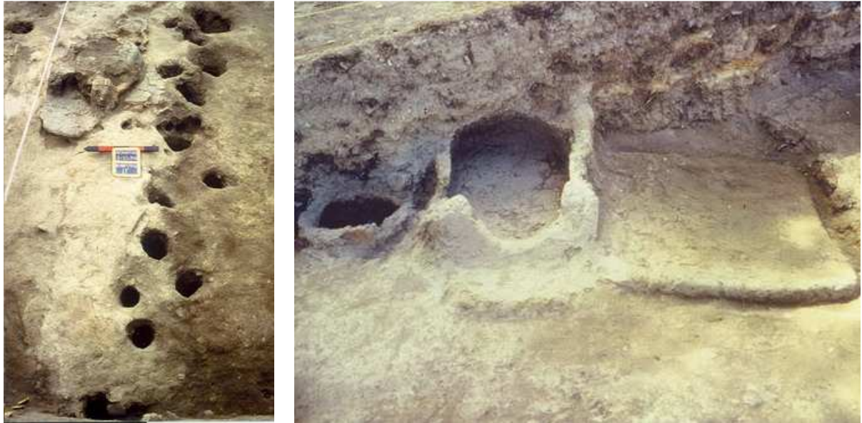
Εικόνα 13: Πασσαλόπηκτα οικήματα και φούρνοι της πρώιμης εποχής στο Αρχοντικό.

Τομέας Αρχαιολογίας, Τμήμα Ιστορίας και Αρχαιολογίας Αριστοτελείου Πανεπιστημίου Θεσσαλονίκης < http://www.hist.auth.gr/tomeis/archaeology/research/excavations/arhondiko.htm >.