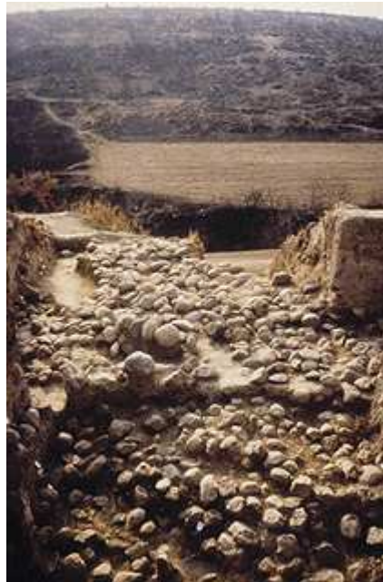
Εικόνα 9: Περίβολος της νεότερης-τελικής νεολιθικής στο Μάνδαλο.