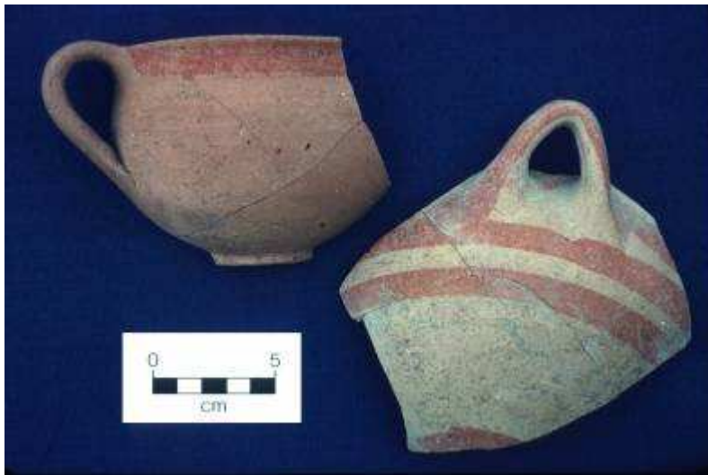
Εικόνα 15: Τοπική μυκηναϊκή κεραμική από την Άσσηρο (γύρω στο 1150 π.Χ.)

Kenneth A. Wardle, Institute of Archaeology and Antiquity, University of Birmingham < http://artsweb.bham.ac.uk/aha/kaw/Assiros/assirosmycenaean2.htm >.