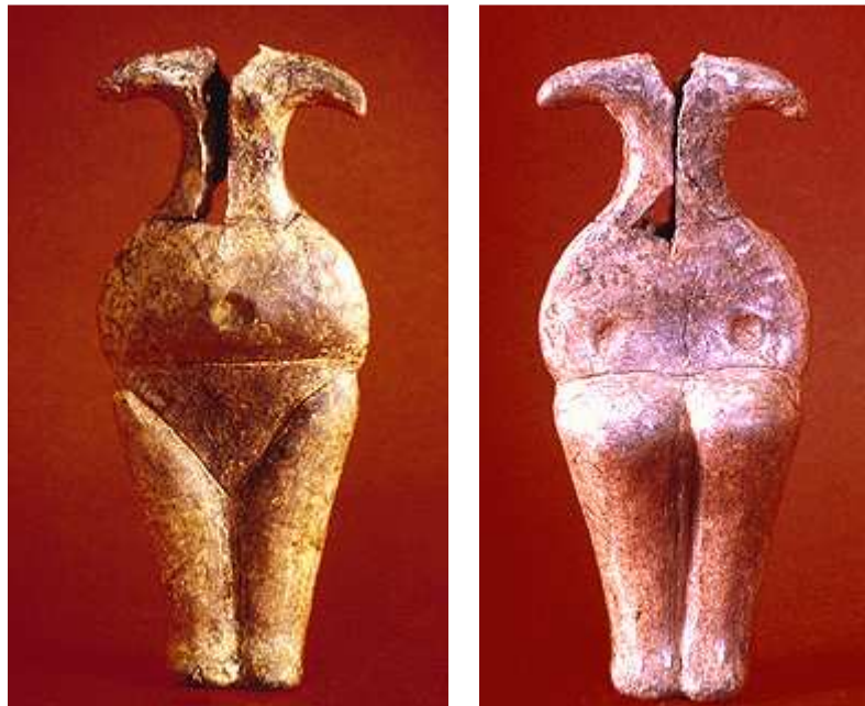
Εικόνα 4: Γυναικείο ακρόλιθο ειδώλιο της νεότερης νεολιθικής (Μάνδαλο, Αρχαιολογικό Μουσείο Πέλλας).