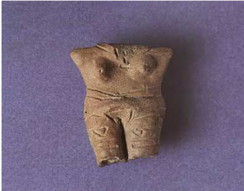
Εικόνα 2: Γυναικείο ειδώλιο από πηλό της νεότερης νεολιθικής (Μακρύγιαλος).

Μάνθος Μπέσιος και Μαρία Παππά, Πύδνα , Κατερίνη: Πιερική Αναπτυξιακή, 1995, 25.