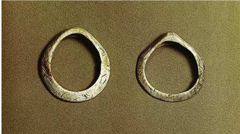
Εικόνα 7: Κοσμήματα από Σπόνδυλο (Σιταγροί, Αρχαιολογικό Μουσείο Δράμας).

Δημήτριος Ρ. Θεοχάρης, Νεολιθική Ελλάδα , Αθήνα: Εθνική Τράπεζα της Ελλάδος, 1973, εικ. 110.