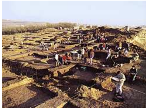
Εικόνα 10: Τάφροι της νεότερης νεολιθικής στον Μακρύγιαλο.

Μάνθος Μπέσιος και Μαρία Παππά, Πύδνα , Κατερίνη: Πιερική Αναπτυξιακή, 1995, 23.