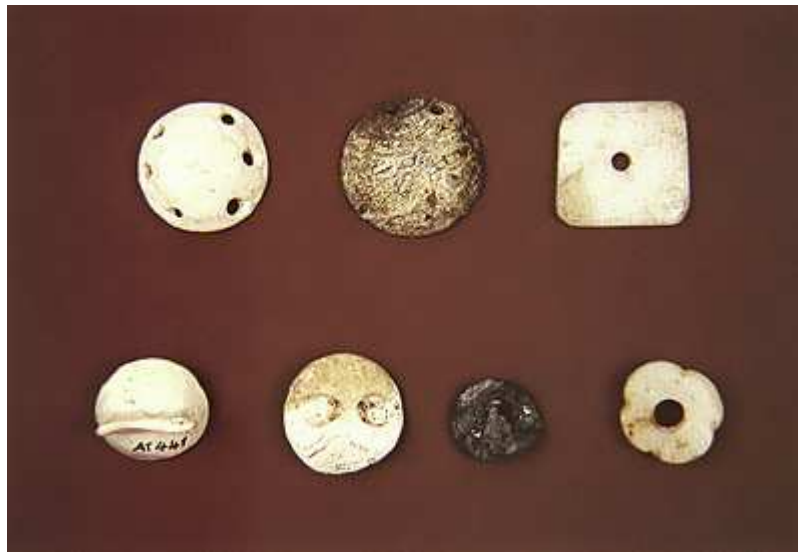
Εικόνα 8: Κοσμήματα από Σπόνδυλο της τελικής νεολιθικής (Μακρύγιαλος).

Μάνθος Μπέσιος και Μαρία Παππά, Πύδνα , Κατερίνη: Πιερική Αναπτυξιακή, 1995, 32.