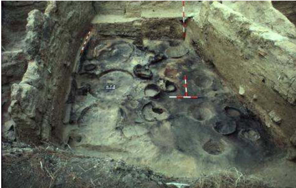
Εικόνα 11: Αποθηκευτικοί χώροι της ύστερης εποχής του χαλκού στην Άσσηρο.