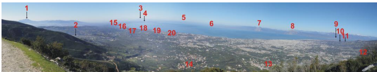
1.Όρος Σκόλλις 2.Καλλιθεόκαμπος (Καλλιθέα) 3.Κεφαλονιά (Αίνος) 4.Τείχος Δυμαίων (Άραξος) 5.Λευκάδα 6.Μεσολόγγι 7.Βαράσοβα 8.Κλόκοβα (Παλιοβούνα) 9.Ρίο-Αντίρριο 10.Αγ. Κυριακή 11.Βούντενη 12.Κλάους 13.Κρήνη 14.Σαραβάλι 15.Νιφορέικα 16.Αλίσσος 17.Καμίνια 18.Τσουκαλείκα 19.Βραχνέικα 20.Μονοδένδρι

Αυτά που αναφέρθηκαν παραπάνω είναι μερικές από τις ιδιομορφίες και τα βασικά χαρακτηριστικά της θάλασσας του Πατραϊκού. Με την παρατήρηση και την εμπειρία λοιπόν, σε μία καλοτάξιδη θάλασσα οι κάτοικοι της δυτικής Αχαΐας της Ύστερης Εποχής του Χαλκού κατέκτησαν τις γνώσεις της ναυτιλίας και έτσι κατάφεραν να αναπτύξουν το εμπόριο και να μεταφέρουν τα προϊόντα και την τοπική παραγωγή τους στα υπόλοιπα κέντρα της Μεσογείου.