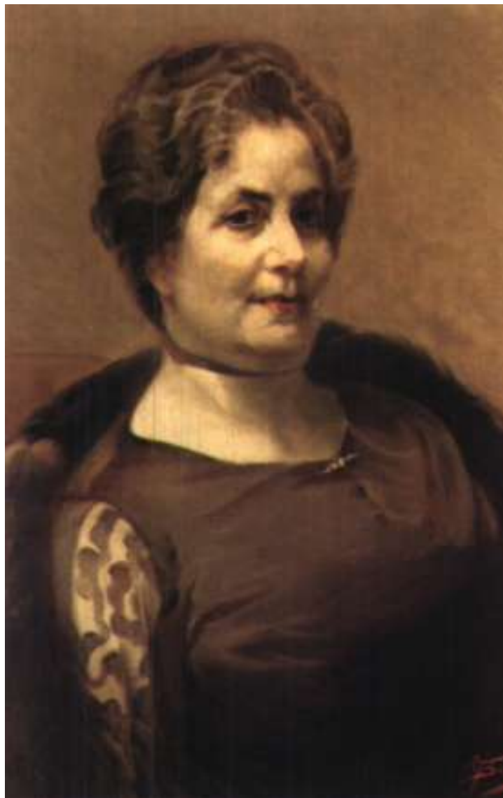
Εικόνα 6. Καλλιρόη Σιγανού-Παρρέν (Παγκόσμιο βιογραφικό λεξικό 1988, τόμ. 8: 180, www.greekencyclopedia.com/parren-kallirro-i-platania-amarioy-kritis-1859-athina-1940-p4848.html ).

Κατά το παράδειγμα του Νικολάου Πολίτη, ιδρυτή της Ελληνικής Λαογραφικής Εταιρείας (1909), η Παρρέν ίδρυσε το Λύκειο των Ελληνίδων (1911), σκοπός του οποίου ήταν «ό μεταξύ τῶν γυναικῶν τῶν γραμμάτων, τῶν ἐπιστημῶν καί τῶν τεχνῶν καί ἐν γένει τῶν ἀνωτέρας ἀναπτύξεως σύνδεσμος, πρὸς ἐξυπηρέτησιν τῆς προόδου τοῦ φύλου των» 56 μέσω της διαφύλαξης της ελληνικής παράδοσης. 57 Οι δύο φορεῖς συνεργάζονταν και είχαν κοινά μέλη. Η Αποστολάκη ήταν από τις πρώτες γυναίκες της Εταιρείας, μαζί