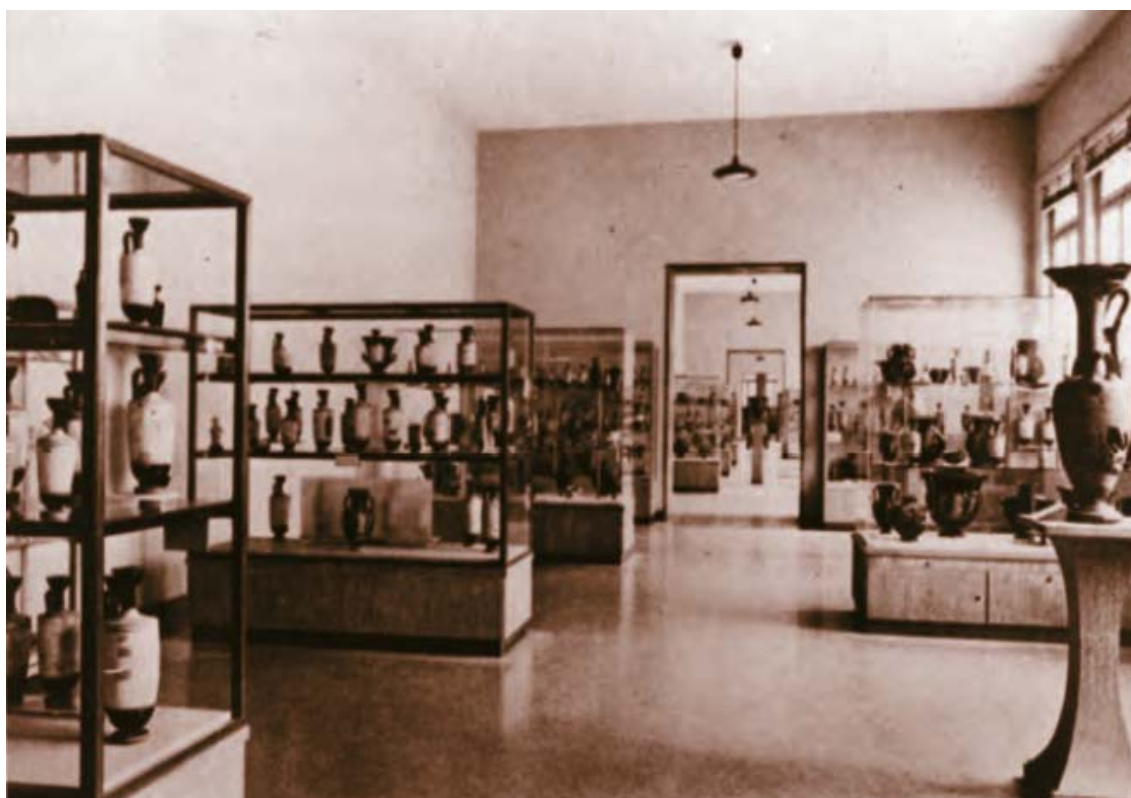
Εικόνα 27. Η μεταπολεμική έκθεση των αγγείων (Στασινοπούλου 2010: 98, εικ. 3).

Πολύ βιαστικός, πολύ κοινωνικός ο σημερινός άνθρωπος, δεν διαθέτει τη συγκέντρωση που χρειάζεται για τη μελέτη, μισεί τη vita contemplativa . Έμαθε όμως, όπως κάθε ταξιδευτής, να είναι παρατηρητής. Και τούτο δεν είναι μικρό πράγμα. «Ο στοχασμός είναι περισσότερο ενδιαφέρων από τη γνώση, όχι όμως και από την παρατήρηση», είπε κάπου ο Γκαίτε. 281