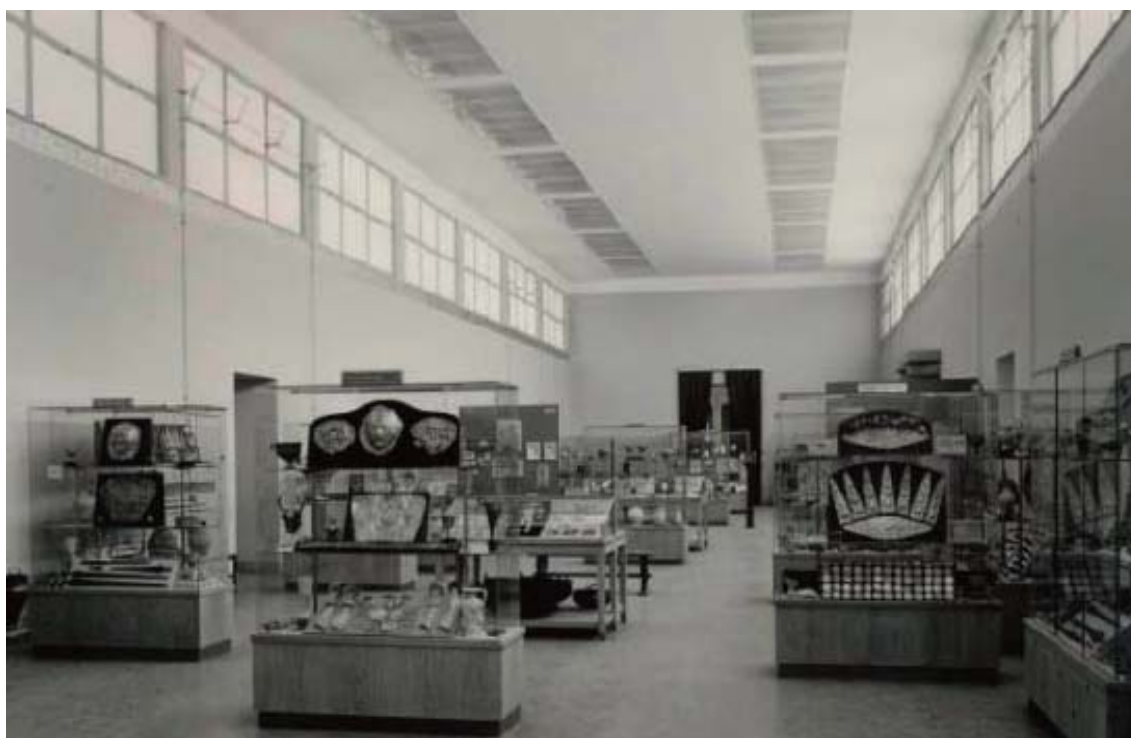
Εικόνα 25. Η αίθουσα των μυκηναϊκών του Εθνικού Αρχαιολογικού Μουσείου μετά τα εγκαίνιά της το 1957 (Παπάζογλου-Μανιουδάκη 2010: 107, εικ. 2).

Μουσείου για πάρα πολλά χρόνια. Προσπαθήσαμε όμως να μεταβάλομε την ανάγκη σε αρετή: εκθέσαμε λοιπόν μαζί μαρμάρινα γλυπτά, χάλκινα και αγγεία σε τρόπο που να είναι διδακτικός, γιατί τα συγγενικά έργα μπήκαν κοντά-κοντά, ώστε να διαφωτίζουν το ένα το άλλο, αλλά και αρκετά αραιά, ώστε να μη χάνει το κάθε έργο την ατομικότητά του και να μη τα βλέπει ο θεατής σαν μια σειρά από ομοιόμορφα πράγματα· αφ' ετέρου πιστεύομε ότι το αίσθημα της άνεσης, που αποκτά έτσι ο θεατής, κάνει την έκθεση και ελκυστική. 258