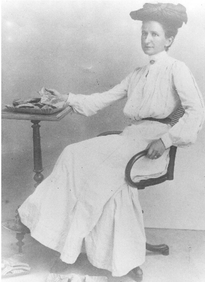
Εικόνα 1. Harriet Boyd, Ηράκλειο, 1904 (;) (Smith College, www.smith.edu/libraries/libs/archives/gallery/images/biography/sc_hawes.jpg ).

Ο διευθυντής της Αμερικανικής Σχολής Rufus Richardson είχε απορρίψει το αίτημα της Harriet Boyd να χρηματοδοτήσει από την υποτροφία της ανασκαφές στην Κόρινθο και την Κρήτη, με το επιχείρημα ότι «μια γυναίκα δεν θα μπορούσε να αντέξει τις ταλαιπωρίες». 12 Εκείνη όμως ήταν αποφασισμένη να τον διαψεύσει και τον διέψευσε. Η πρώτη γυναίκα που διηύθυνε ανασκαφή στην Ελλάδα συνεργάστηκε επίσης με γυναίκες, τη Jean Patten στο Καβούσι (1900) και τις Blanche Wheeler και Edith Hall στα