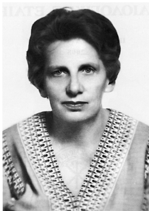
Εικόνα 16. Άννα Μαραβά-Χατζηνικολάου (πρωτοσέλιδο του τιμητικού τόμου στη μνήμη της, Δελτίον της Χριστιανικής Αρχαιολογικής Εταιρείας 29, 2008, Εθνικό Κέντρο Τεκμηρίωσης: ejournals.epublishing.ekt.gr/index.php/deltion/article/view/5285/5034 ).