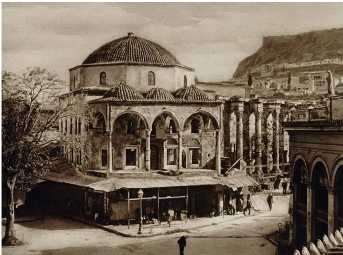
Εικόνα 8. Το Τζαμί Τζισδαράκη στο Μοναστηράκι (1928), όπου στεγαζόταν το Μουσείο Ελληνικής Λαϊκής Τέχνης έως το 1973· σήμερα λειτουργεί ως παράρτημά του.

κατόπιν ως επιμελήτρια (1926-1935) και τέλος ως διευθύντρια (1935-1954) –η πρώτη γυναίκα που διηύθυνε μουσείο στην Ελλάδα.