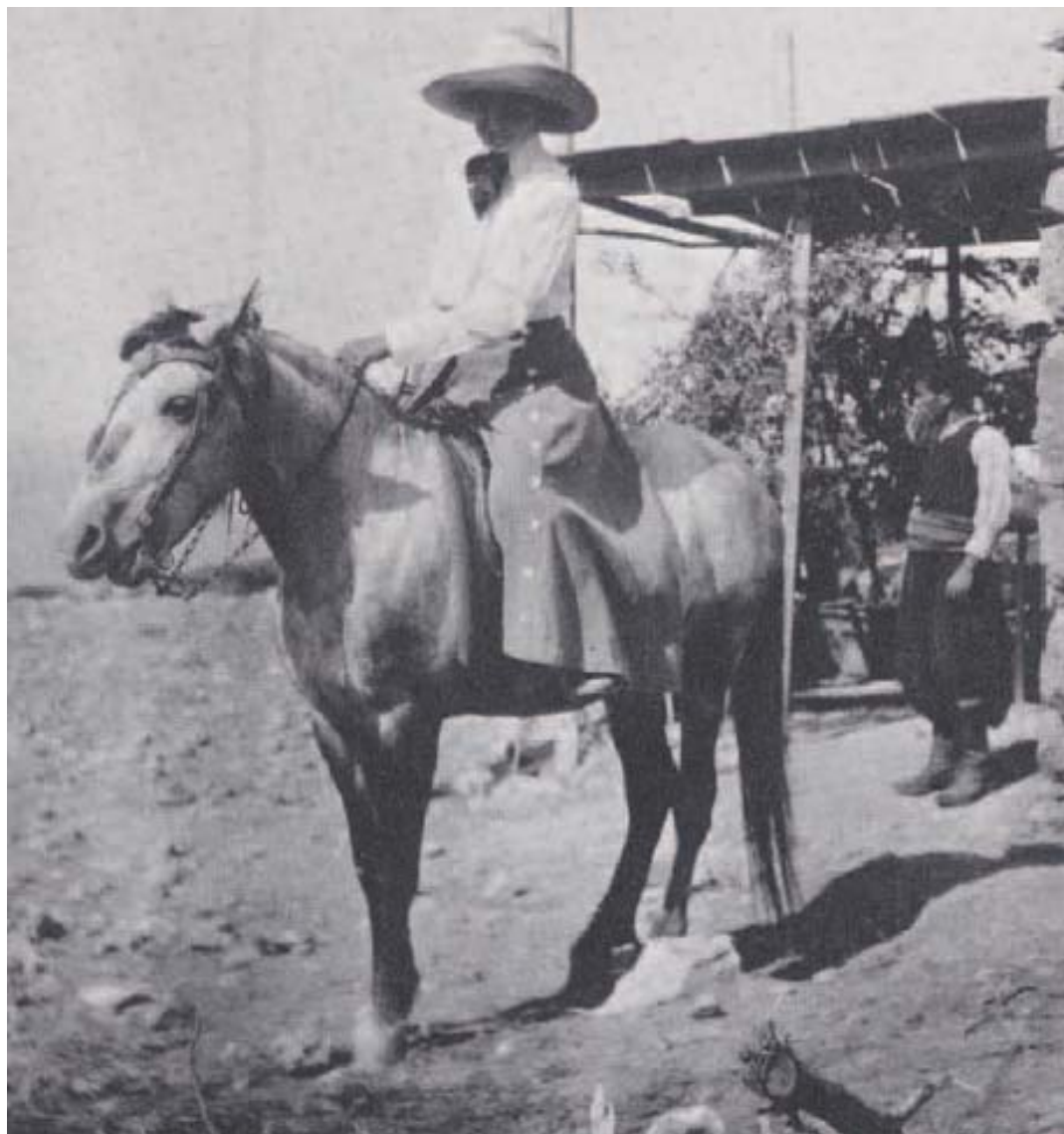
Εικόνα 2: Edith Hall, Βρόκαστρο, 1912 (έκθεση Breaking ground, breaking tradition: Bryn Mawr and the first generation of women archaeologists , Bryn Mawr College Library, 2007, www.brynmawr.edu/library/exhibits/BreakingGround/dohan.html ).

Γουρνιών στον Richard Seager, 21 ο οποίος αναγνώρισε μόνο κατ' ιδίαν την οφειλή στη συνεργάτιδά του. 22 Η Boyd προσέκρουσε σε ό,τι αποκαλείται σήμερα «γυάλινη οροφή», στο αόρατο φράγμα που επιτρέπει στις γυναίκες να βλέπουν την κορυφή, όχι όμως να τη φτάνουν. 23