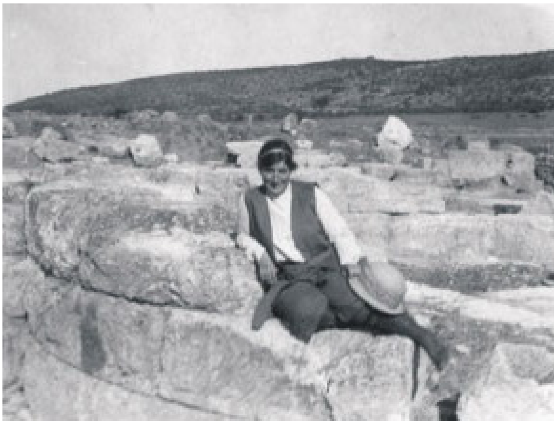
Εικόνα 4. Hetty Goldman, Αλές, 1912 (;).

όσο το δυνατόν πιο μακριά από την Αθήνα. 26 Το αμερικανικό προηγούμενο θα ανοίξει τον δρόμο και στις Βρετανίδες. 27