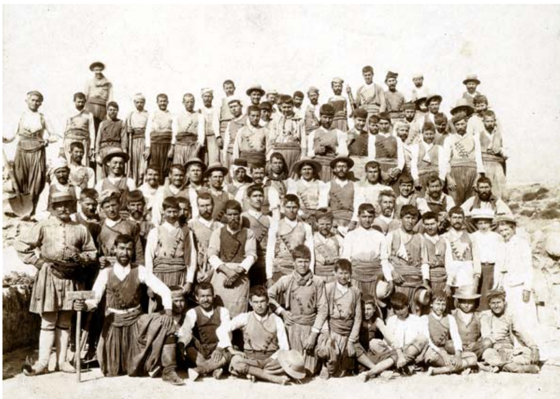
Εικόνα 3. Ανασκαφή στα Γουρνιά, 1904. Στη δεύτερη σειρά από δεξιά η Harriet Boyd και η Edith Hall (έκθεση Breaking ground, breaking tradition: Bryn Mawr and the first generation of women archaeologists , Bryn Mawr College Library, 2007, www.brynmawr.edu/library/exhibits/BreakingGround/dohan.html ).

Η συνεργασία των Boyd και Hall θα συμβάλει στην άρση των απαγορεύσεων: το 1908 η Elizabeth Gardiner και το 1910 η Alice Walker θα συμμετάσχουν στην ανασκαφή της Αμερικανικής Σχολής στην Κόρινθο και το 1911 η Walker και η Hetty Goldman θα αναλάβουν εν μέρει με δικά τους έξοδα και χωρίς ανδρική επίβλεψη την ανασκαφή στις Αλές (Φθιώτιδα). 24 Ο διευθυντής της σχολής Bert Hodge Hill, αν και είχε αρνηθεί στη Goldman να ανασκάψει στην Εύτρηση (Βοιωτία), στη συνέχεια πείστηκε να προσυπογράψει το αίτημα προς τις ελληνικές αρχές για ανασκαφή στις Αλές, παρά την επιφυλακτικότητα των τελευταίων ως προς την καινοφανή ιδέα δύο «ασυνόδευτων» γυναικών σε μια απομακρυσμένη τοποθεσία. 25 Όπως διηγούνται η ίδια χρόνια αργότερα, η συναίνεσή του οφειλόταν στην επιθυμία του να στείλει τις δύο γυναίκες