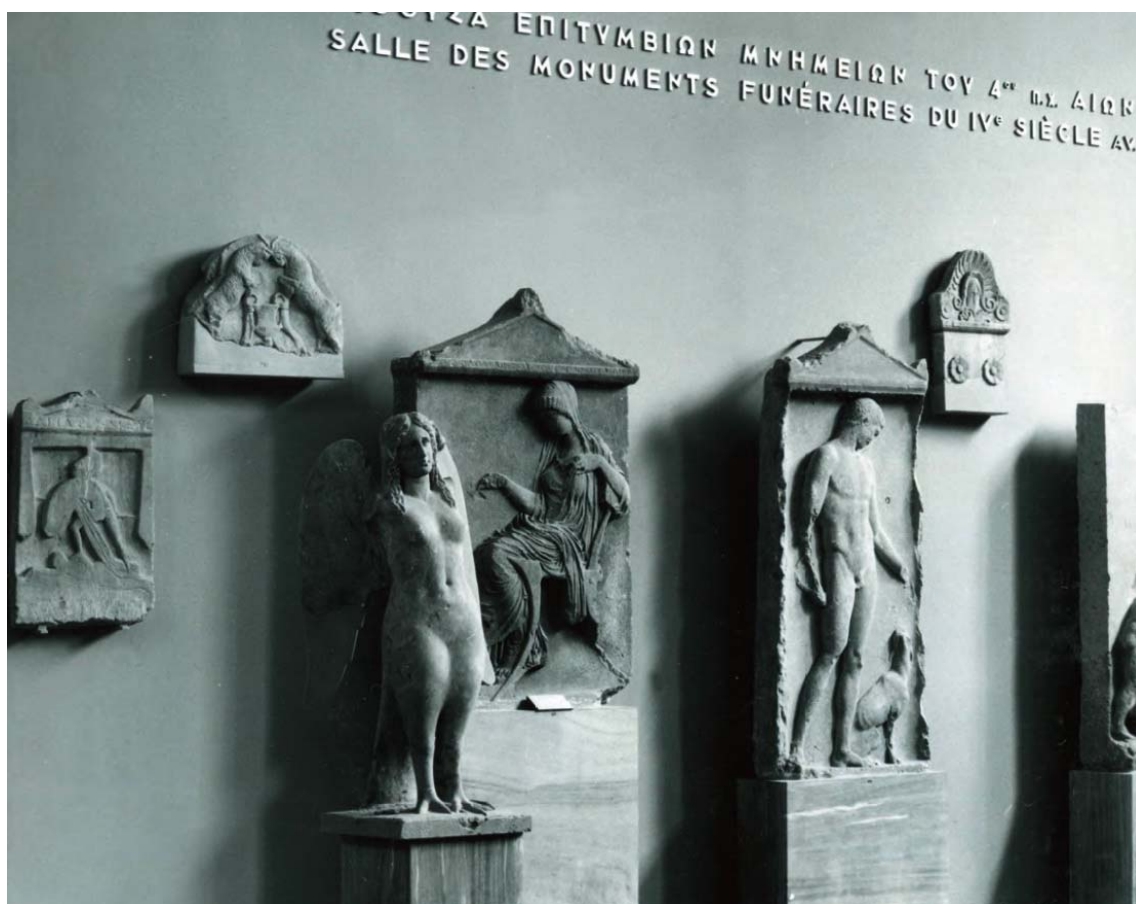
Εικόνα 26. Η αίθουσα των επιτυμβίων γλυπτών τη δεκαετία 1960 (Βλαχογιάννη 2010: 84, εικ. 2).

Μάννα, καλλιτέχνες, φοιτητές απ' όλο τον κόσμο, αστοί, εργάτες, κληρικοί (καθολικοί) έτρεξαν να διδαχτούν. Τις Κυριακές ο λαός γεμίζει τις αίθουσες, γέροι, ώριμοι, παιδιά, στριμώχνονται για ν' ακούσουν τις εξηγήτριες των αρχαίων. Ο λαός που έχει μέσα του αρχαίο αίμα, αυτός είναι που χάρηκε σ' εμάς τα ξαναγεννημένα Μουσεία πολύ περισσότερο παρά οι μορφωμένοι. 268