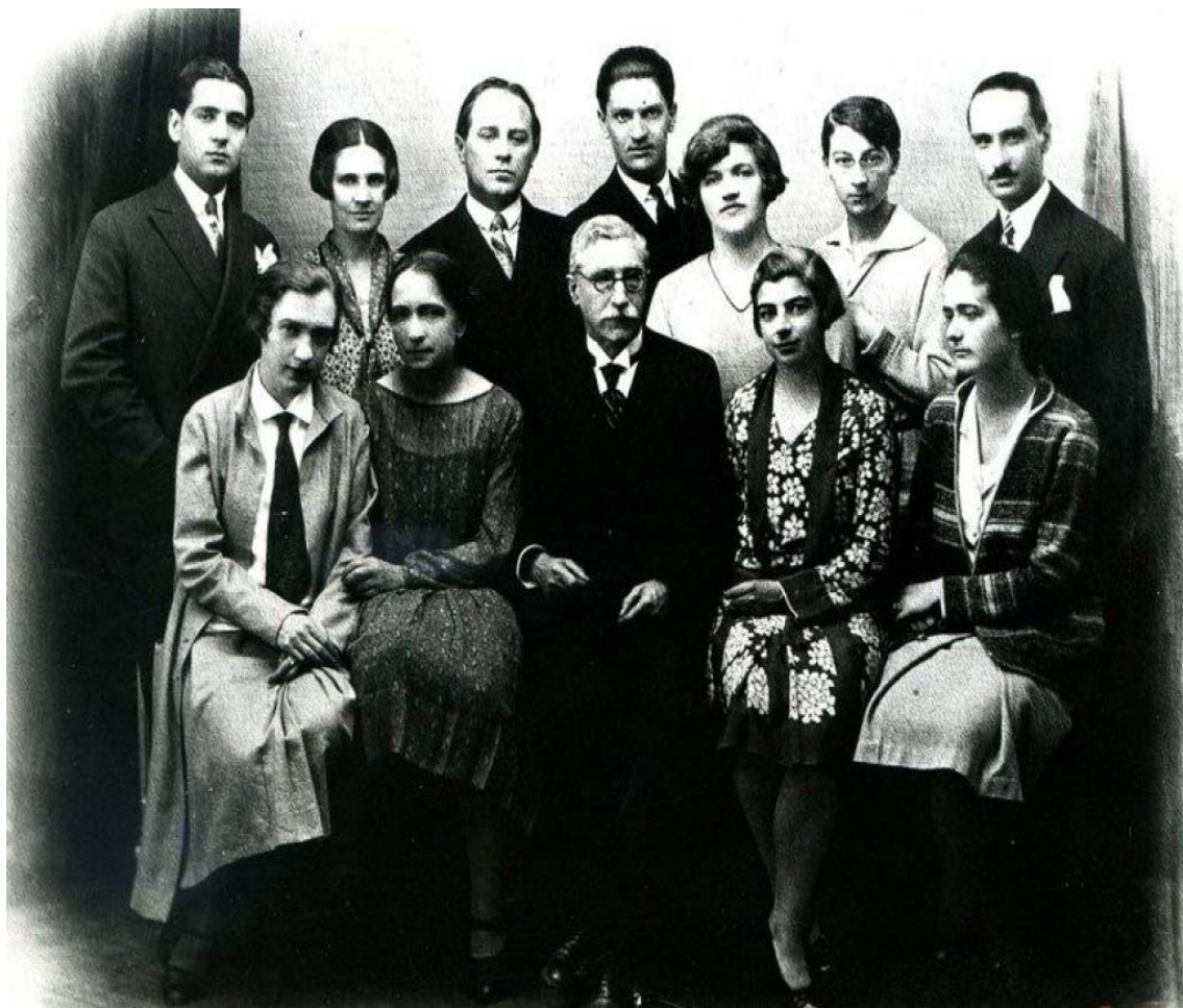
Εικόνα 17. Ο βυζαντινολόγος Gabriel Millet (πρώτη σειρά) με φοιτητές και φοιτήτριές του στην École des Hautes Études στο Παρίσι (1929): πίσω του δεξιά η Βενετία Κώττα.

Διδάκτωρ του Πανεπιστημίου του Παρισιού, είναι η πρώτη γυναίκα που υποβάλλει αίτηση υφηγεσίας στο Πανεπιστήμιο Θεσσαλονίκης (21 Μαΐου 1933), 105 καταθέτοντας προς κρίση δύο συγγράμματα στο γνωστικό αντικείμενο της «μεσαιωνικής ελληνικής φιλολογίας». 106 Η συνεδρίαση των καθηγητών της Φιλοσοφικής Σχολής αναθέτει την